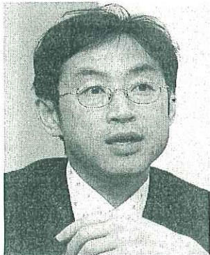
人材の採用・育成が最大の課題

「30人の社長を世に出す『30社構想』を掲げていますね。社内から新規事業を生み出すビジネスモデルは、起業家を目指す若者には魅力的です。」