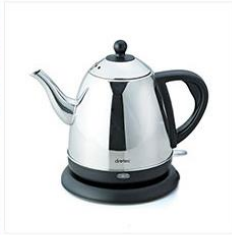
<dretec> 電気ケトル0.8L PO-115BK3