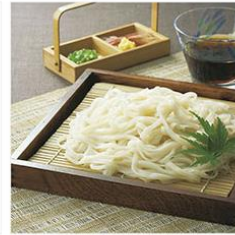
手延縮庭うどん 150g×10束