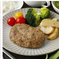
米沢牛入肉屋のハンバーグ 115g×6個