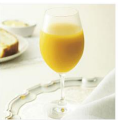
<銀座千足屋> 銀座千足屋マンゴードリンク 900ml×4本