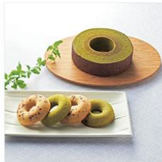
<京寿楽庵> 宇治抹茶パウム 葵