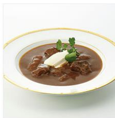
<キッチン飛騨> 黒毛和牛カレー中辛 (290g×5缶) & ビーフシチュー (290g×4缶)