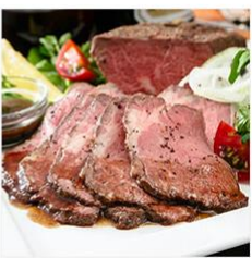
<リストランテマッサ神戸勝彦監修> ローストビーフ400g パルサミソース付