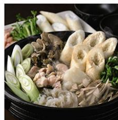
比内地鶏 きりたんぼ鍋セット 5~6人前