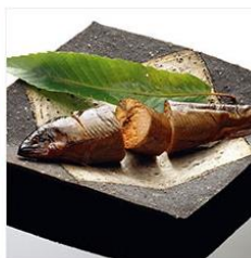
<新橋玉木屋> 鮎のこもち宝 5尾入