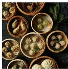
<Grande chef> 点心懐石 3~4人前