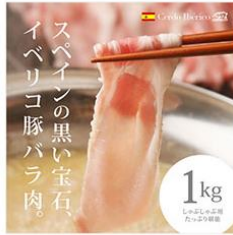
<イベリコ豚 黒い宝石> イベリコ豚 バラ肉 鍋・しゃぶしゃぶ用スライス 1kg