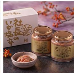
社長のいか塩辛 極 (きわみ) 200g×2個