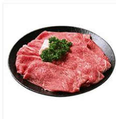
近江牛 モモ・バラすき焼き用 計400g