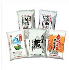
新潟米食べ比べセット 計10kg