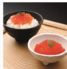
羅白産 いくら醤油漬 50g×4個