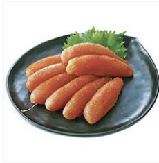
<かねふく> 無着色辛子明太子 450g