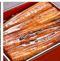
浜松・浜名湖うなぎ蒲焼 2人前 (110g×2枚)