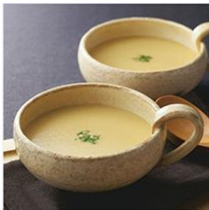
<福島正八> クリームコーンスープ 8缶